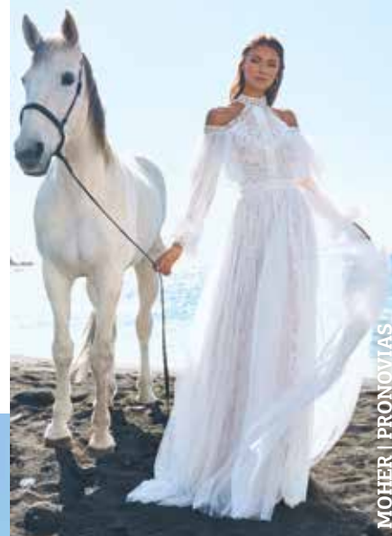
MOHER | PRONOVIAS