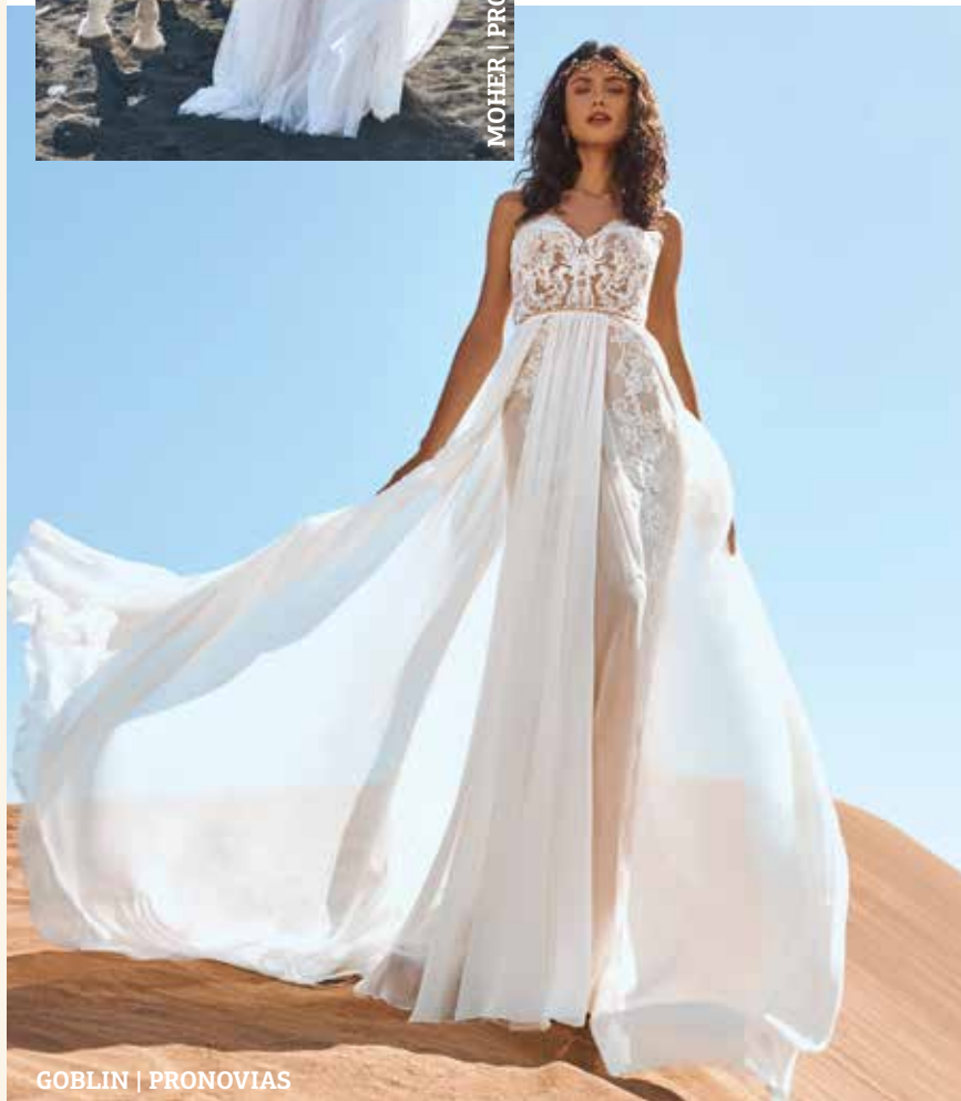
GOBLIN | PRONOVIAS

Εκπληκτικές δαντέλες, σιφόν υφάσματα και ιδιαίτερα κεντήματα κυριαρχούν στα boho dresses που περιμένουν όλες τις νύφες στο multibrand Pronovias Store AthenaV, για να βιώσουν την απόλυτη bridal fitting εμπειρία.