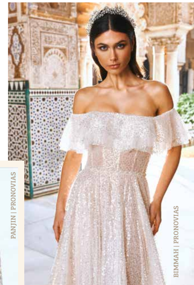
BIMMAH | PRONOVIAS