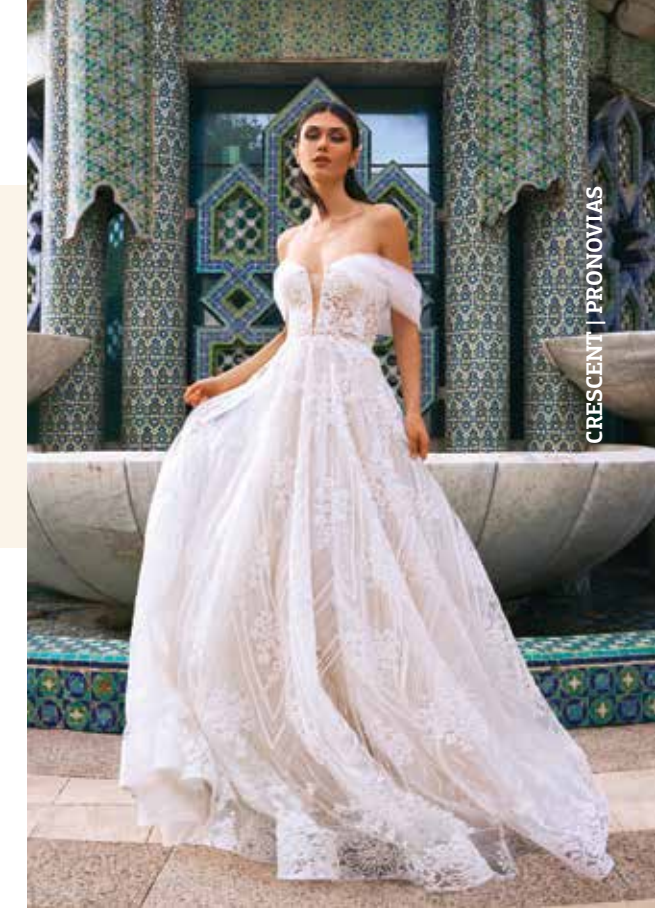
CRESCENT | PRONOVIAS

Το multibrand store AthenaV είναι ο απόλυτος προορισμός για κάθε νύφη που λατρεύει τα A-line dresses. Νυφικά με απλικέ λουλούδια, αέρινα υφάσματα και εντυπωσιακά V ντεκολτέ είναι σίγουρο ότι θα κάνουν δύσκολη την επιλογή σας.