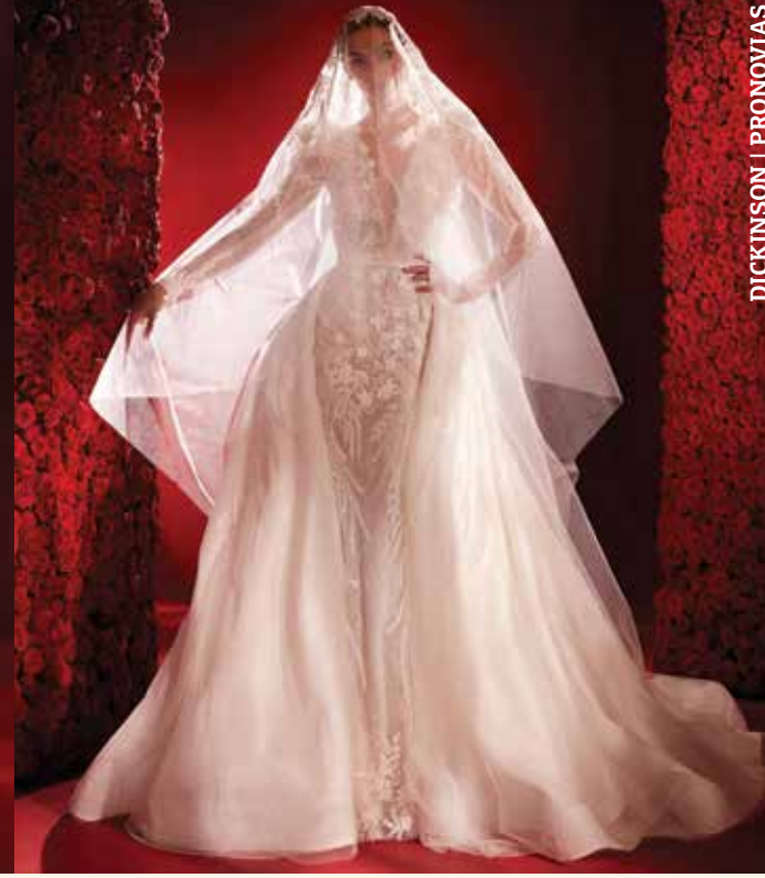
DICKINSON | PRONOVIAS