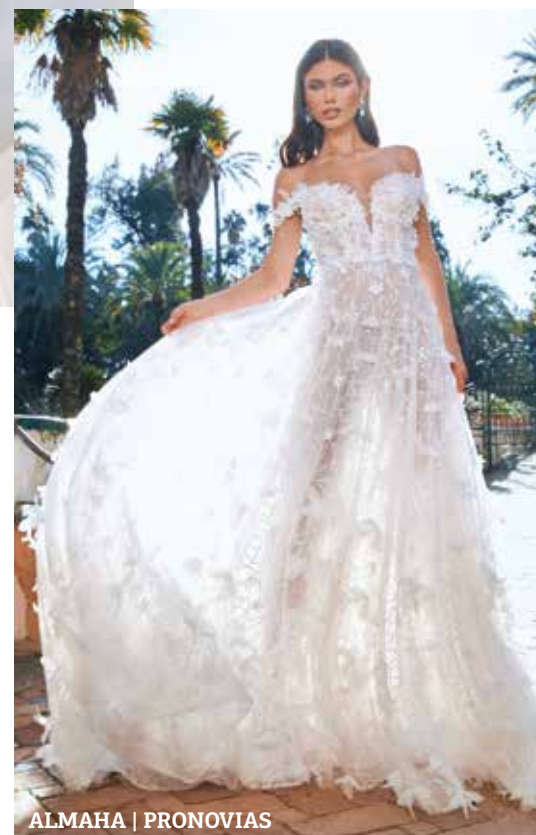
ALMAHA | PRONOVIAS

Η ικανότητά του να επιμπήκει τον λαιμό καθιστά το ντεκολτέ σε σχήμα καρδιάς μια εξαιρετικά δημοφιλή επιλογή για τις μέλλουσες νύφες. Ένα strapless σχέδιο με αποσιώμενα μανίκια θα κάνει ακόμα πιο ρομαντικό το look κάθε bride-to-be.