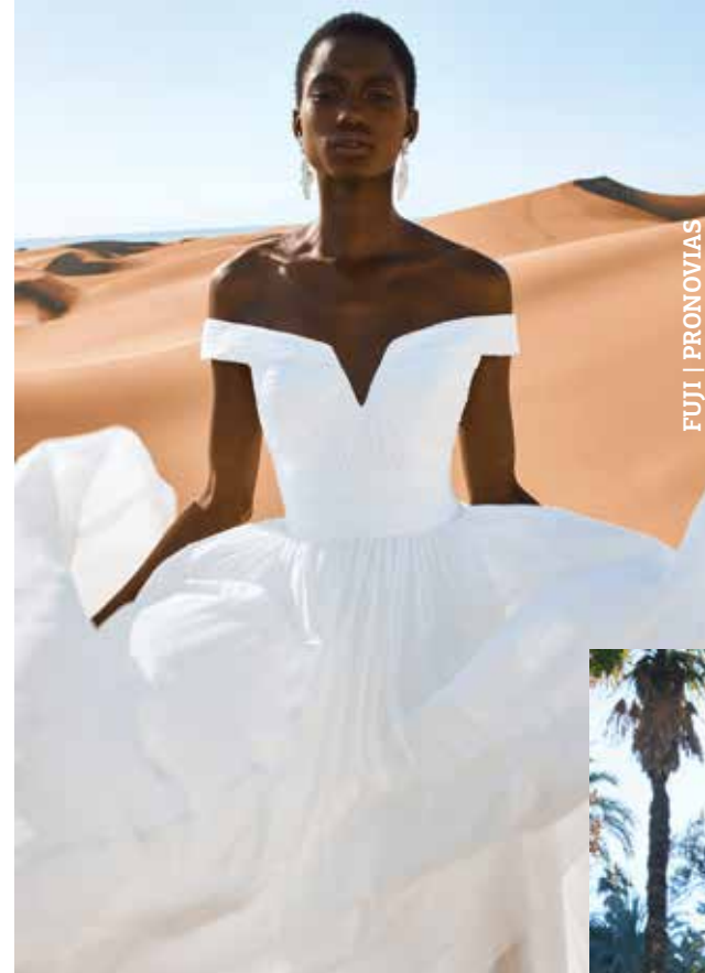
FUJI | PRONOVIAS