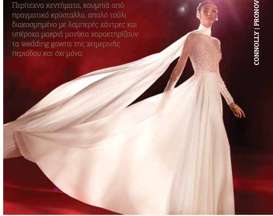
CONNOLLY | PRONOVIAS

Περίτεχνα κεντήματα, κουμπιά από πραγματικό κρύσταλλο, απαλό τούλι διακοσμημένο με λαμπερές χάντρες και υπέροχα μακριά μανίκια χαρακτηρίζουν τα wedding gowns της χειμερινής περιόδου και όχι μόνο.